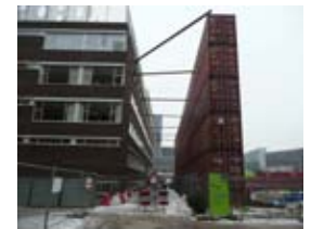
Containerwand Ds. Jan Scharpstraat