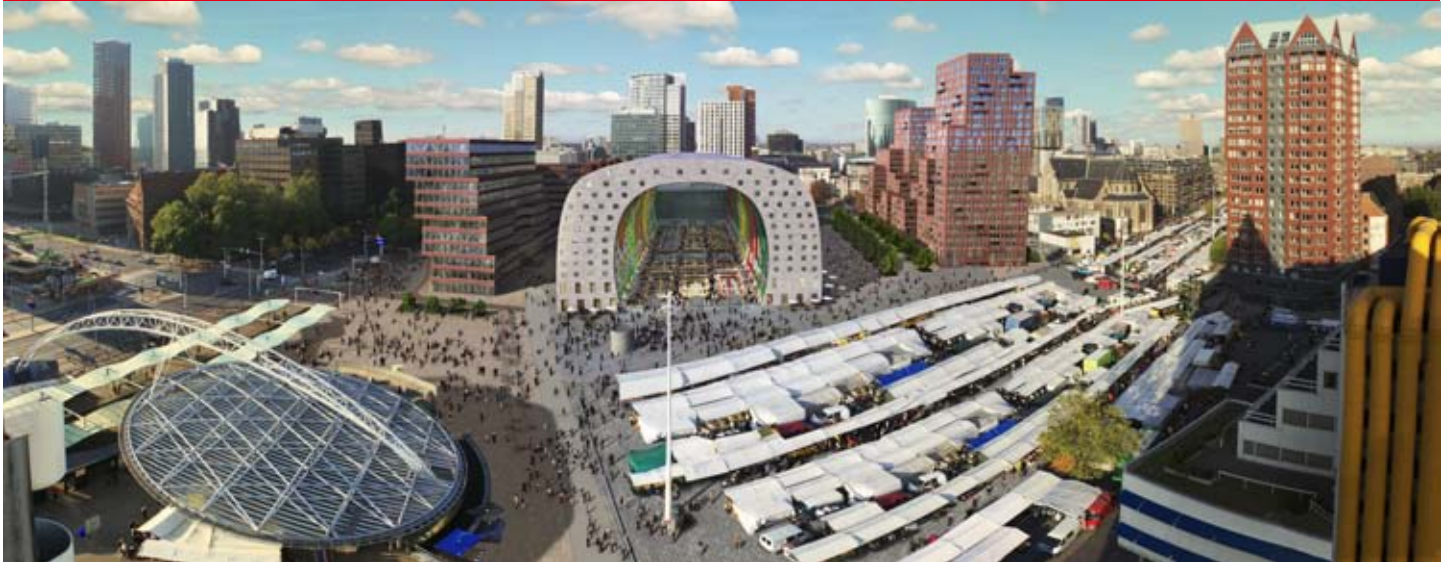
Artist impression Markthal Rotterdam