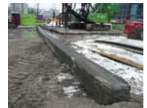
Alle oude heipalen zijn bijna allemaal uit de grond