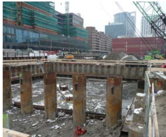
Werkzaamheden op het bouwterrein

Buiten kantooruren kunt u dringende zaken melden via T 140 10